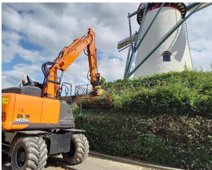
Het groen rondom de molen wordt geknipt.

www.martinusmolen.nl ; facebook.com/martinusmolen en https://twitter.com/martinusmolen .